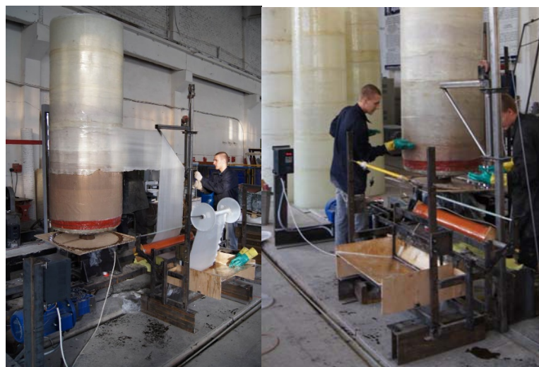
Рис. 2. Лабораторная установка вертикальной намотки в процессе работы (изготовленные оболочки на заднем плане)

Разработанная технология может работать как при горизонтальной, так и при вертикальной схеме намотки. Намотка может выполняться как стеклянными нитями (ровингом), так и стеклотканью. На устройство для вертикальной намотки стеклотканью получен патент на полезную модель РФ [11].