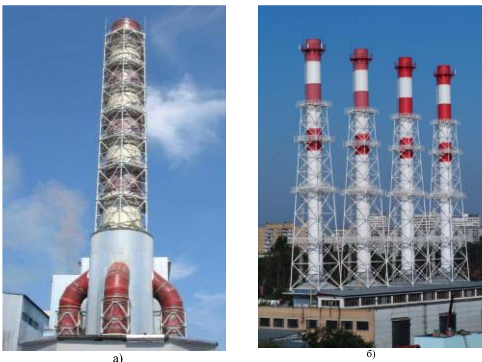
Рис. 1. Стеклопластиковые газоотводящие стволы:

За последние 10...12 лет, как в России, так и за рубежом значительно возросло количество конструкций газоотводящих трактов, выполненных из стеклопластиков. В России за последние 15 лет построено и успешно эксплуатируется около 120 стеклопластиковых дымовых труб высотой до 150 м, диаметром до 5 м, а также газоходов на промышленных предприятиях Москвы, Урала, Сибири, Удмуртии, Дальнего Востока, Украины. Отдельные примеры показаны на рис. 1.