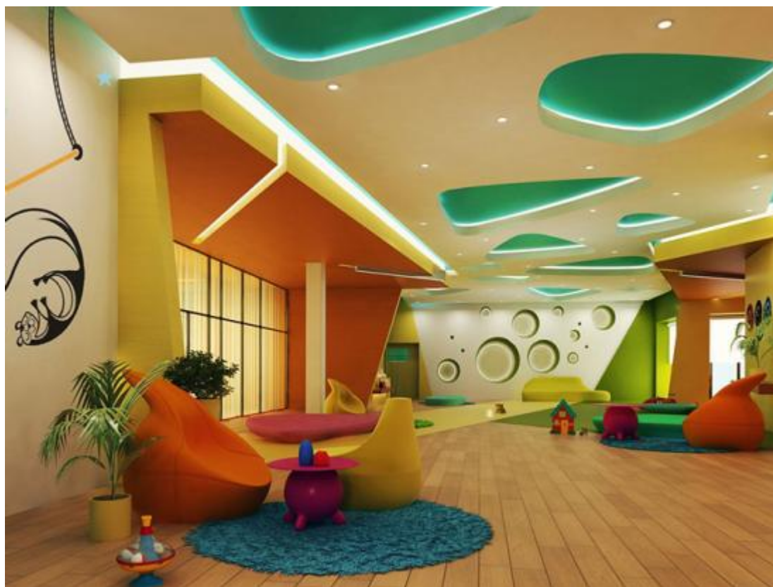
Рис.5. – Пример планировки игровой комнаты [13]

Немаловажной составляющей является эмоциональное состояние. Поэтому стандарт WELL отдельное внимание уделяет психологическому здоровью. Так, дизайн и проектирование детского дошкольного образовательного учреждения должны способствовать отсутствию дискомфорта и раздражителей, вызывающих стресс у детей. Пространство должно положительно влиять на трудоспособность, энергичность и жизнерадостность ребенка (рис.5.).