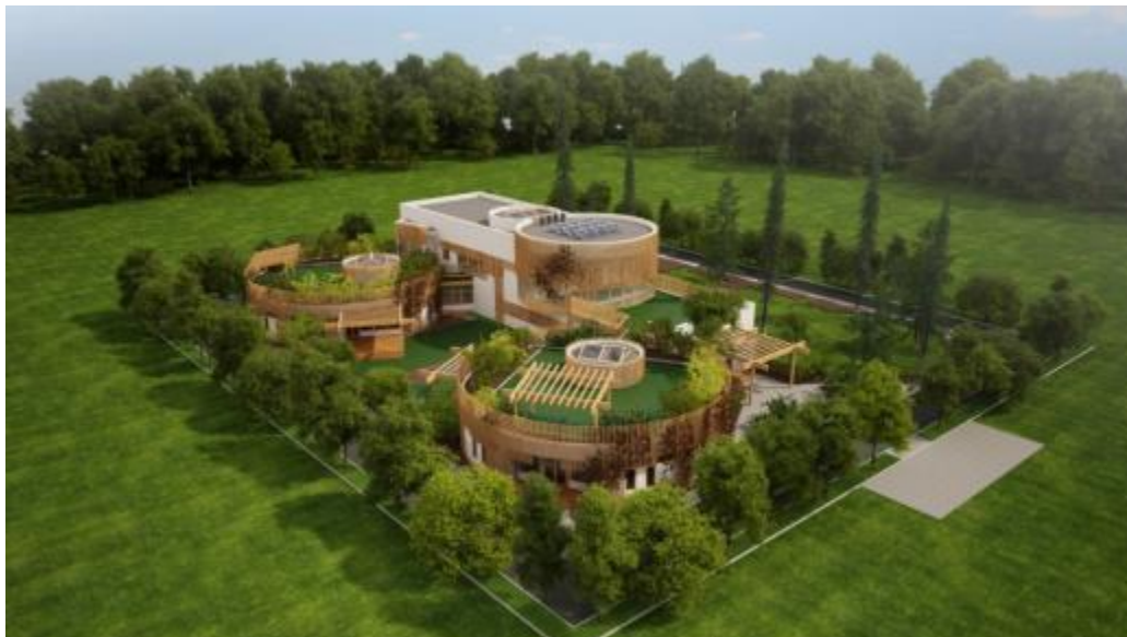
Рис.7. – Пример озеленения территории детского сада [17]

улучшения начальной стадии жизни, со строительства детских дошкольных образовательных учреждений?