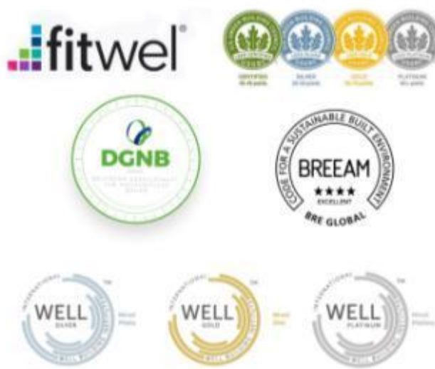
Рис.1. – Эмблемы сертификаций

предоставления доступа к дневному свету и обеспечения искусственного освещения [3].