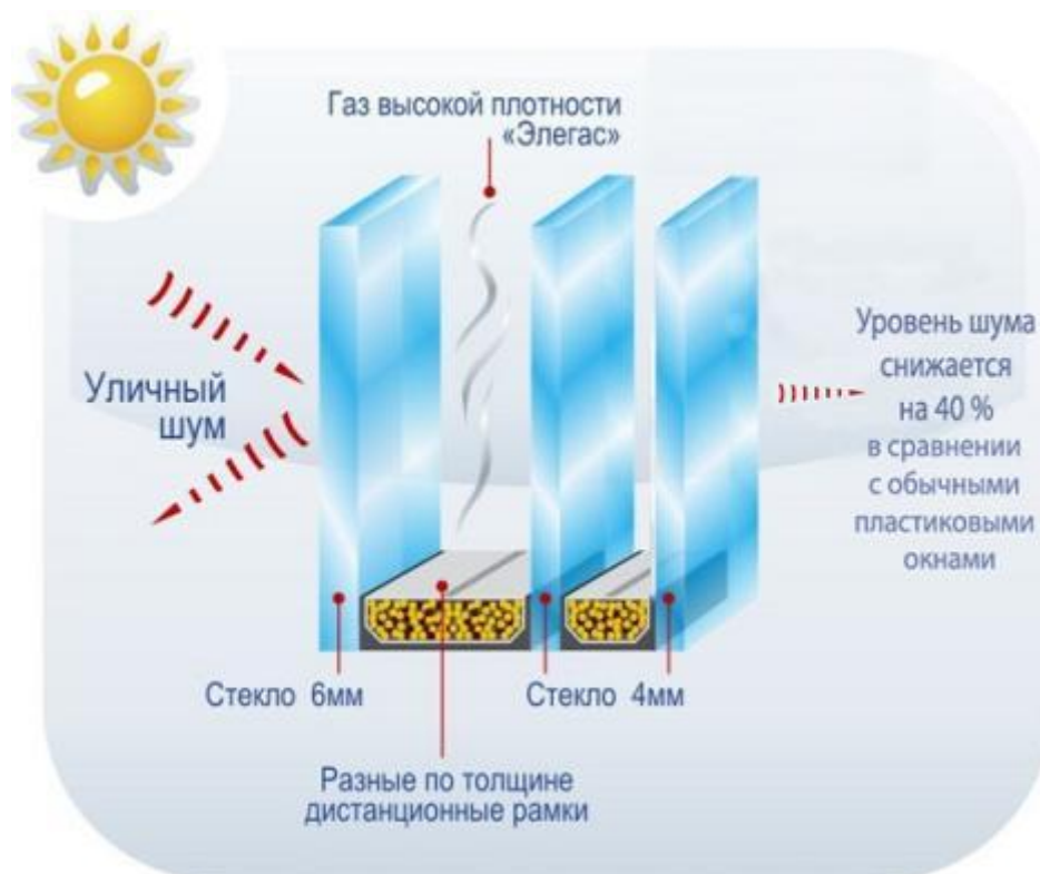
Рис.6. – Схема шумоизоляционного окна [15]

шумоизоляционное остекление, состоящее из трех и более стекол (рис.6.) [14].