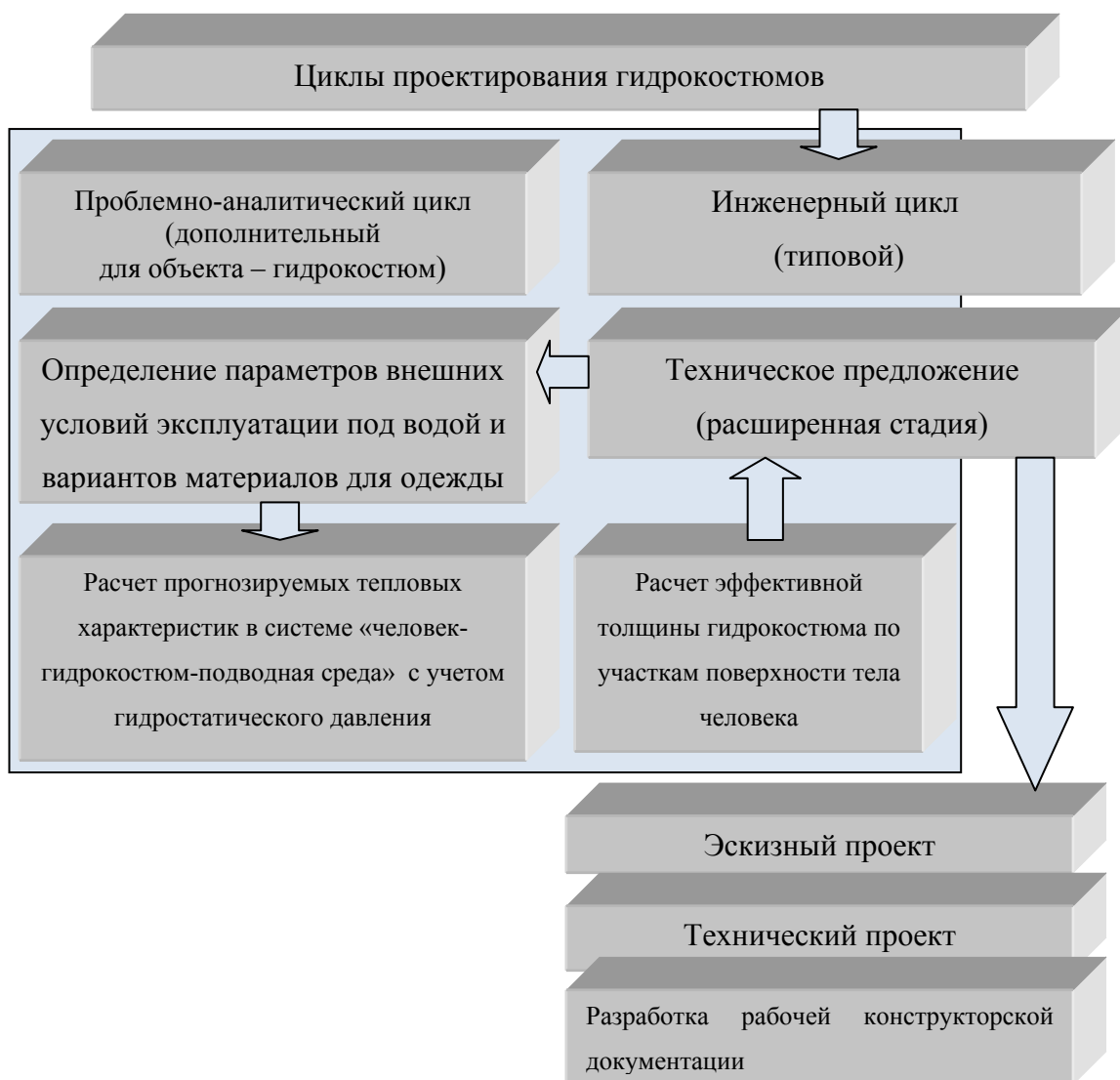
Рис. 1. – Усовершенствованная схема формализации циклов проектных работ с учетом специфики эксплуатации одежды под водой

На рис.1 представлена разработанная усовершенствованная схема формализации циклов проектных работ с учетом специфики эксплуатации изделий под водой.