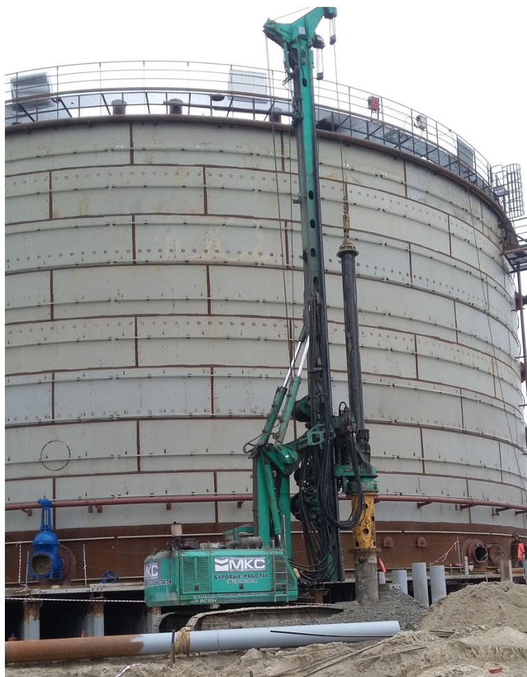
Рис 1. Буровая установка Вауег 18 подготавливает свайный фундамент для сетей обвязки трубопроводов резервуаров нефти

Сваи в вечной мерзлоте должны быть спроектированы таким образом, чтобы они сдерживали осадку в приемлемом диапазоне. Между тем, прилагаемая нагрузка не должна превышать кратковременную прочность контакта грунта с грунтом ворса [2].