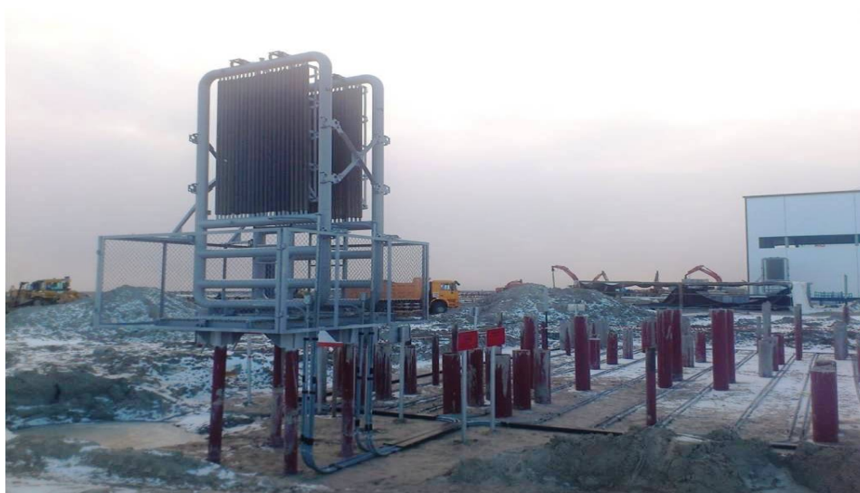
Рис.3. Типичная термосифонная структура, установленная на объекте Приемо – сдаточный пункт (ПСП) Новопортовского месторождения

IV) Плоско-пружинный термосифон по обозначению описывается как труба с плоской петлей испарителя под фундамент с перекрытием, может использоваться для удержания грунта под перекрытием в промерзшем состоянии на ровном основании.