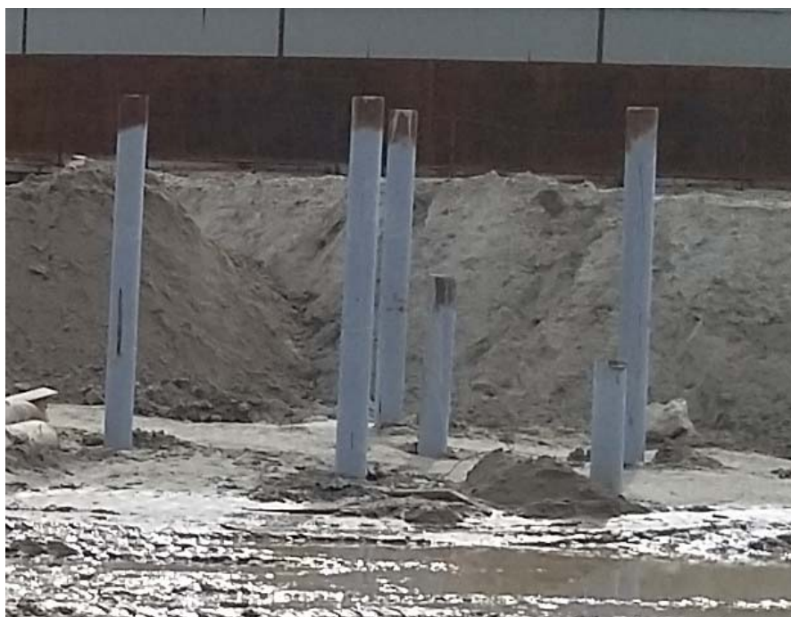
Рис 2. Свайное основание для лафетного ствола на объекте «Приемо – сдаточный пункт (ПСП) Новопортовского месторождения»

Гравий и валуны являются пористой средой с очень эффективной естественной конвекцией зимой и в теплое время года. Этот материал в сочетании со специально разработанными сваями позволяет избежать оттаивания в мерзлых грунтах [4].