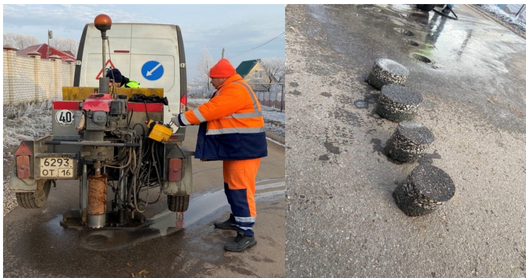
Рис. 3. Отбор кернов дорожного покрытия экспериментального участка на автомобильной дороге – подъезд к н.п. Ключищи Республики Татарстан

применением цеолита возможно не только в Республике Татарстан, но и на территории всего Приволжского Федерального округа.