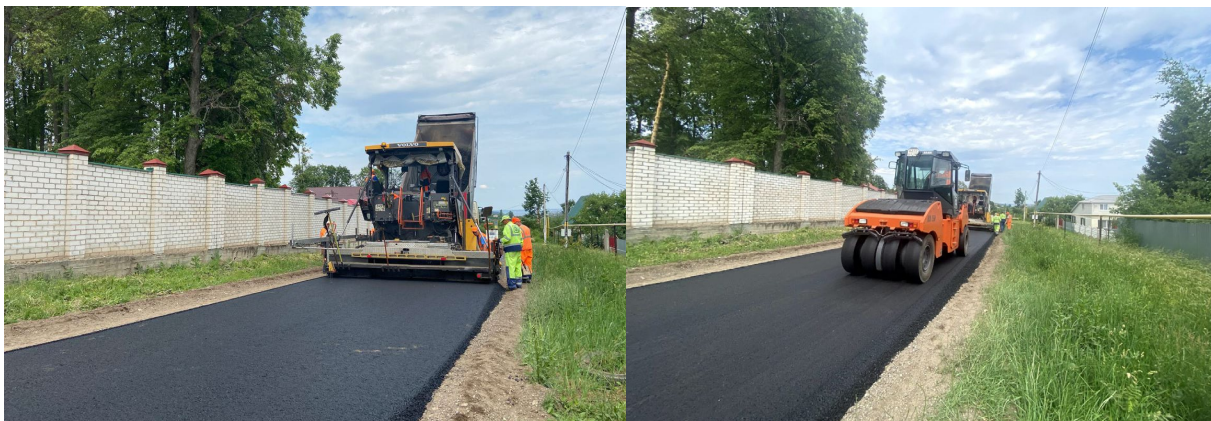
Рис. 2. Укладка и уплотнение теплой асфальтобетонной смеси А16Вл с применением цеолита Татарско-Шатрашанского месторождения

Вomag 90, Hamm HD 110 (рис. 2). Температура укладки смеси 122 °С. Производство работ по устройству обочин осуществляли по стандартной технологии в соответствии с рабочей документацией.