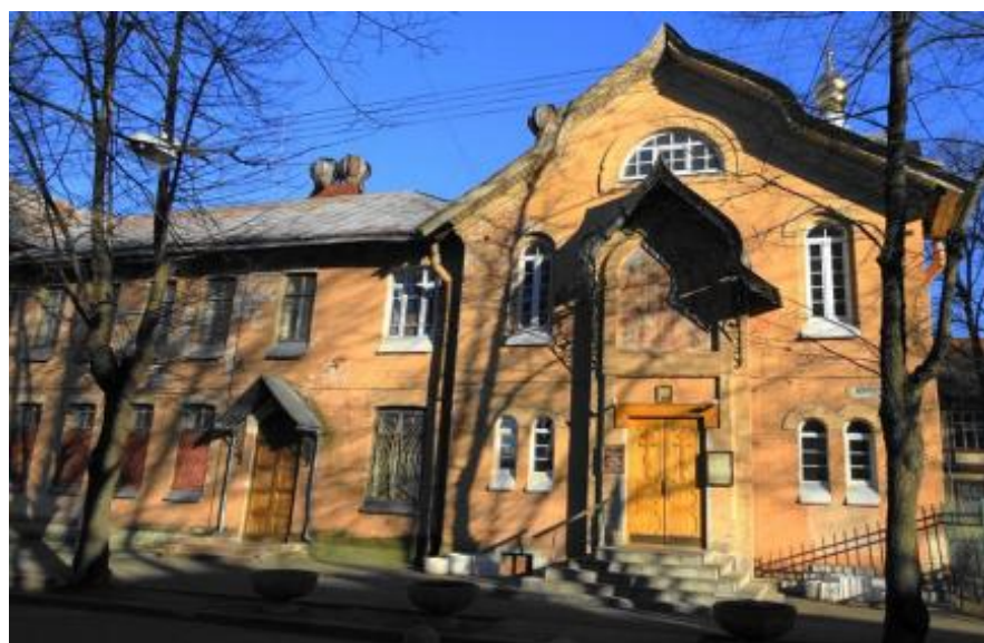
Рис. 5. – Современный вид храма «Всех скорбящих Радость» [10]

дворового крыла здания. Сама водолечебница также изменила первоначальное местоположение, она была перенесена из лицевого пролета здания по Леонтьевской улице в дворовый пролет в противоположную часть здания, окнами во двор. Для водолечебницы это удобнее, так как в окна можно вставить матовые стекла, что для наружного фасада было бы некрасиво. В дворовой части фасада был устроен дополнительный вход через тамбур, расположенный под главной лестницей, где также находился спуск в подвальное помещение под церковь – вход со двора сохранился до настоящего времени. При таком расположении водолечебницы ею могли пользоваться как платные, так и бесплатные больные. Последние могли входить с отдельного дополнительного входа со двора. Кроме того, новое положение водолечебницы позволило несколько сократить объем водопроводных работ, т.к. расстояние от нее до котельной стало меньше. После завершения всех строительных работ архитектор С.А. Данини должен был составить соответствующий отчет и передать его в вышестоящую инстанцию — Главное управления Российского общества Красного Креста, которое финансировало строительство [9].