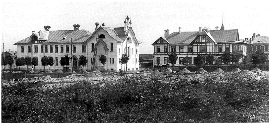
Община сестер милосердия. Амбулатория, богадельня и церковь (слева), общежитие сестер (справа). Фотография 1914 г.

В начале 1908 г. Комитет был преобразован в Царскосельскую Общину сестер милосердия Красного Креста, состоящую под покровительством императрицы Александры Федоровны. Выделенный ранее участок Комитета перешел в собственность Общины сестер милосердия. На участке по проектам архитектора С.А. Данини были построены два здания. Первое, деревянное здание (Леонтьевская ул., 33) возвели в 1907 г., и уже в 1908 г. в нем принимали первых посетителей. Здесь первоначально разместились общежитие сестер милосердия, приемный покой с операционной и отдельные комнаты для больных. Внешний облик здания был решен в форме фахверковой архитектуры, в типичной для архитектуры С.А. Данини.