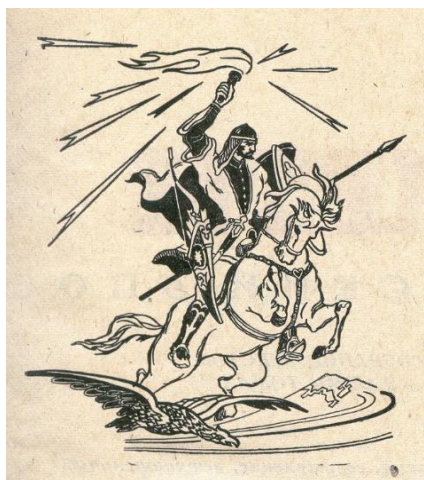
Рис.2.–Народный герой нарт Сосруко