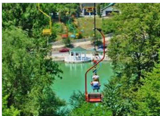
Рис.4. – Нальчик. Канатно-кресельная дорога [11]

Место строительства было выбрано достойное (рис. 3). Гора Малая Кизиловка выигрышно открывает прекрасный вид на город. Правда, возведение головы нарта оказалось делом вовсе непростым. Эта гора сложена из рыхлых грунтовых пород, которые в ходе строительства в результате насыщения влагой стали тяжелеть и сползать, оголив фундамент. Тем более, что в том году весна оказалось снежной и дождливой. Из предложенных решений – сооружение опорной стены для укрепления склона, установка свай, которые приходилось доставлять вертолётом – в конечном итоге остановились на следующем: были пробиты вертикальные шахты глубиной более 15 метров, в которые залили бетон [10]. Параллельно со строительством впечатляющего по тем временам архитектурного ансамбля, который много раз удостаивался различных премий, был разбит прекрасный парк и организовывались подъездные пути.